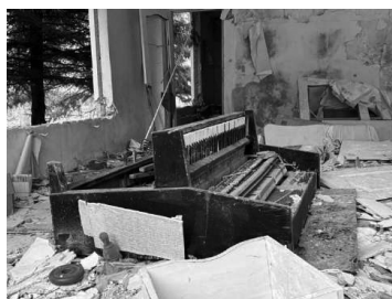
Внутренние помещения детского сада № 464.

Мониторинговая миссия российских правозащитников посетила этот район Харькова 19 января 2025 года. В Северной Салтовке мы видели масштабные разрушения жилой застройки. Неповрежденных домов практически не было. Даже там, где незаметны явные следы попаданий или пожаров, в большинстве зданий были видны выбитые окна, заделанные фанерой.