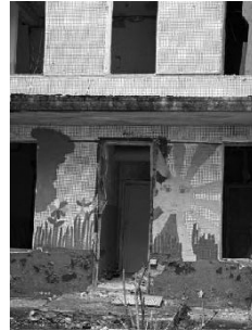
Здание детского сада № 464.

Сердюка, Натальи Ужвий и Метростроителей (Метробудівників), выходящие к северо-восточным окраинам Харькова 135 . Район покинуло большинство проживавших там до начала полномасштабного вторжения, оставшиеся люди прятались от обстрелов в подвалах. Собственно военные объекты — Научно-производственное предприятие «Хартрон», Национальный аэрокосмический университет «Харьковский авиационный институт», аэродром — концентрируются в поселке Жуковского (укр. Селище Жуковського) 136 , примерно в семи километрах от улицы Натальи Ужвий.