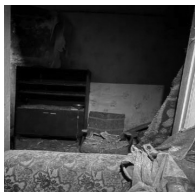
Разрушенный в результате попадания БПЛА дом по улице Алексея Вадатурского, 31.