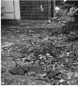
Воронка около здания детского сада диаметром около 3 м.