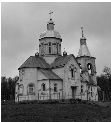
Церковь Рождества Пресвятой Богородицы в селе Довжик.

или их подобия, а при них фильтрационные пункты. В условиях продолжавшихся боевых действий и добровольцев бучанской теробороны, и братьев Куличенко задерживают вполне целенаправленно — по информации, либо имевшейся заранее, либо полученной на месте при допросе. Расстрел, незаконная и произвольная внесудебная казнь совершается не на месте: сначала задержанных доставляют в штаб/комендатуру/фильтрационный пункт (совсем рядом или за десятки километров), где и принимается внесудебное решение, которое затем приводят в исполнение. В этом уже виден некий алгоритм, процедура, взаимодействие различных структур, разделение между ними функций и полномочий.