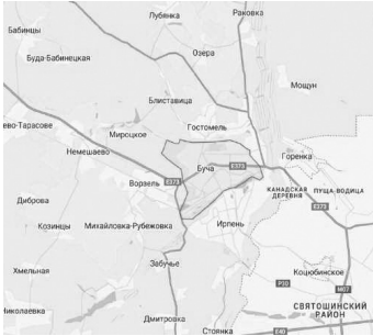
Карта Бучанского района