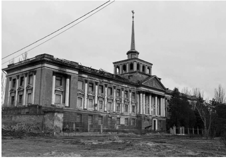
Здание Адмиралтейства, поврежденное в результате ракетного удара.