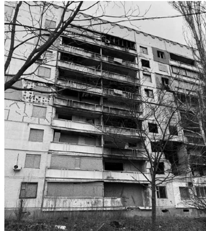
Повреждённый дом на улице Метростроителей.

Харьков — крупный город на северо-востоке Украины, важный промышленный и научный центр страны. В 1919–1934 годах Харьков был столицей Украинской ССР, ныне это административный центр Харьковской области. Его неофициально называют столицей Восточной Украины. Харьков — второй по численности населения (более 1 млн человек) город Украины, и первый — в восточной части страны. Северная окраина Харькова расположена всего в 26 километрах от границы с Россией.