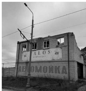
Северная Салтовка. Здание автомойки, разрушенное, вероятно, прямым попаданием.

падения можно с большой степенью уверенности квалифицировать как неизбирательное использование оружия большой мощности.