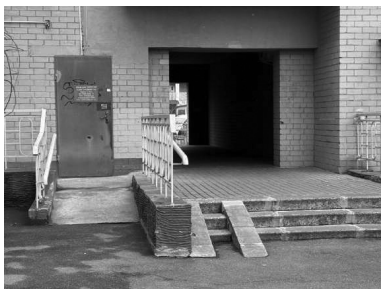
Вход в подвал, где держали Дмитрия Гапченко в ночь с 15 на 16 марта 2022 года.