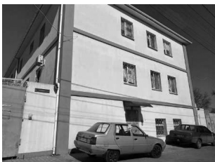
Изолятор временного содержания, улица Теплоэнергетиков, 3, Херсон.

Подобное разделение функций объяснимо: подозреваемых в участии в сопротивлении оккупантам необходимо было держать поблизости от рабочих мест следователей, оперативников, их начальства и штабов, чтобы иметь возможность допросить или доставить для каких-либо оперативных мероприятий.