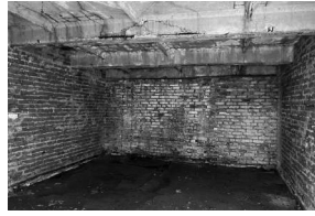
Два гаража при Изюмской городской железнодорожной поликлинике, в которых российские военные держали задержанных. 22 сентября 2022 года.