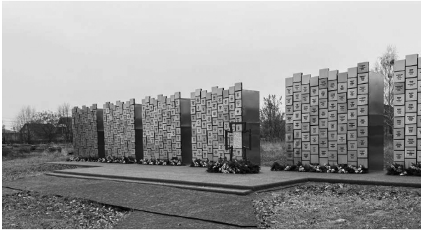
Братская могила у храма Андрея Первозванного и Всех Святых в Буче, памятник с именами убитых жителей города.