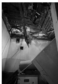
Разрушенный в результате попадания БПЛА одноэтажный дом по улице Алексея Вадатурского, 33.