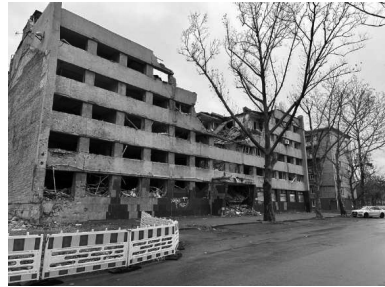
Разрушенное здание бывшей гостиницы «Ингул» (улица Адмиральская, 34).

тирные жилые дома, повреждены стадион и другие социальные объекты и промышленная инфраструктура. Погибли по меньшей мере двое — Герой Украины, генеральный директор аграрного холдинга «Нибулон» Алексей Вадатурский и его супруга Раиса 183 ; ещё два человека были ранены.