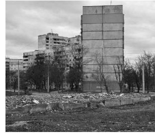
Улица Натальи Ужвий, 82. Остов снесенного первого подъезда.

лом массиве жили более 400 тысяч человек). Северная Салтовка (укр. Північна Салтівка) — местность на северо-востоке Харькова, часть Салтовского жилого массива, относится к Киевскому и Салтовскому районам.