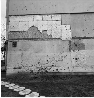
Улица Натальи Ужвий, 86. Следы попадания осколков разорвавшегося снаряда на стене дома.