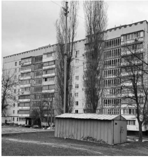
Улица Натальи Ужвий, листы фанеры вместо оконных стекол.