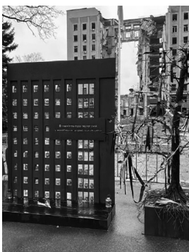
Памятник погибшим в российско-украинской войне около разрушенного здания Николаевской областной администрации.

от обстрелов погибли 178 по меньшей мере пять человек, не менее пяти получили ранения или травмы 179 .