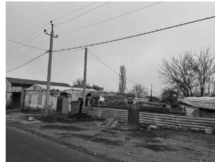
Здания на улице Литовченко. Фото: ЦЗПЧ «Мемориал», 26 января 2025 года

26 января 2025 года миссия посетила улицу Литовченко. Даже год спустя после ракетного удара были хорошо видны его последствия.