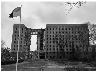
Здание Николаевской государственной областной администрации, разрушенное 29 марта 2022 года и до сих пор не восстановленное.

Выставка разбитой российской военной техники около разрушенного здания Николаевской областной администрации.