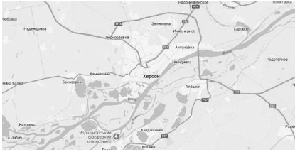
Карта Херсонской области (фрагмент)

Вооружённые российские силовики с закрытыми лицами (Иван полагает, что это был какой-то спецназ) перелезли через забор, схватили его и девушек, надели им на головы мешки и, как они поняли впоследствии, отвезли в секретную тюрьму на Филиппа Орлика.