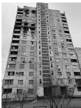
Поврежденные дома на улице Натальи Ужвий.

ные районы города. В ходе наступления российские войска вскоре подошли вплотную к городской черте Харькова, отдельные подразделения проникли в пределы города. В последующие месяцы окраины города стали рубежом его обороны, в том числе и Северная Салтовка. При этом власти при всём старании не могли обеспечить полную эвакуацию миллионного города. С другой стороны, что со стороны российского командования не было никаких предупреждений и призывов к жителям Харькова покинуть зону боевых действий.