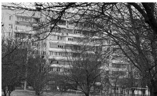
Улица Натальи Ужвий. В доме видны отверстия, прорезанные в закрывающей выбитое окно фанере.

кое разочарование. В нашем подъезде дислоцировались военные. Вышел ихний старшой, капитан, и мягко, но твердо заявил: внутрь пустить не могу. Приказ» 173 . Поэтому у нас недостаточно данных для квалификации обстрелов района в 2022 году как военных преступлений.