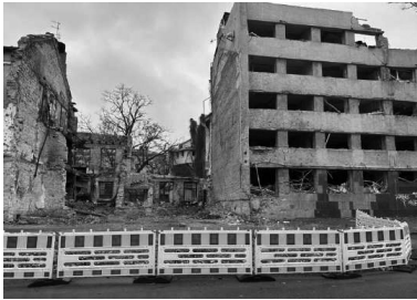
Тут стоял трёхэтажный жилой дом (улица Адмиральская 32).