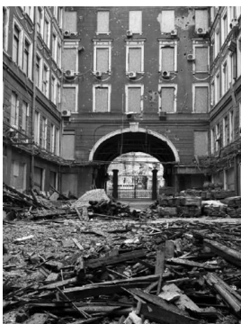
Дворец Труда, площадь Конституции, 1. Памятник архитектуры местного значения, доходный дом 1916 года постройки. Фото: ЦЗПЧ «Мемориал»

«Дом со шпилем», площадь Конституции, 2. Жилой дом в стиле «сталинский ампи́р» построен в 1950 году, входил в список так называемых «семи чудес Харькова». Фото: ЦЗПЧ «Мемориал»