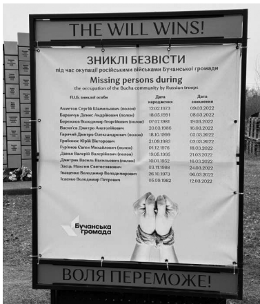
Имена жителей Бучи, пропавших без вести.