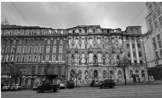
Харьков, Площадь Конституции, 1–7.