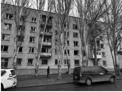
Поврежденный многоквартирный дом на улице Алексея Вадатурского. Видны выбитые взрывной волной окна.