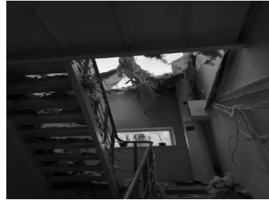
Поврежденный дом на улице Дачная, 5.

Житель дома по улице Алексея Вадатурского, 33, рассказал членам миссии, что в момент прилёта был дома, но сумел вовремя выскочить на улицу. Он услышал крики пожилой соседки: обломками обрушившегося дома ей зажало ноги, развалины загорелись. Соседи вытащили женщину и отвезли в больницу. Дом нашего собеседника был полностью разрушен, остались только стены.