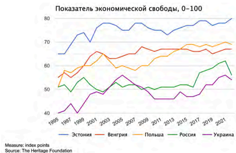
Экономическая свобода в Эстонии, Венгрии, Польше, России и Украине, 1995–2022 гг.

ограниченным, несмотря на приверженность ее населения демократическому выбору. Сочетание политической свободы и экономического неблагополучия дало возможность для возникновения сильной коррупции и становления влиятельной олигархии. Олигархические кланы организовали множество «патрональных пирамид», постоянная конкуренция которых не позволяла ни автократам, ни либеральным демократам полностью преуспеть в управлении Украиной 18 . Также олигархия не позволила экономической свободе закрепиться в Украине.