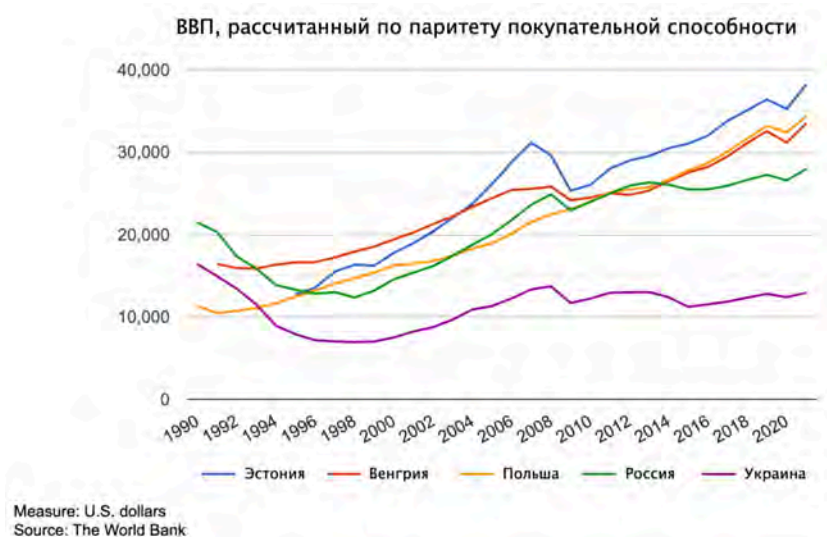
График 2. ВВП по ППС Венгрии, Польши, России, Украины и Эстонии, 1990–2021 гг.

номически самодостаточных граждан-потребителей (так называемого «среднего класса»), которые не хотели бы зависеть от правительства и были бы движущей силой как рынка, так и спроса на демократические реформы. Таким образом, новая социально-экономическая структура с новыми классами была бы фактором, внедряющим практики свободы в политической и экономической сферах и предохраняющим от возвращения советских экономических принципов и моделей.